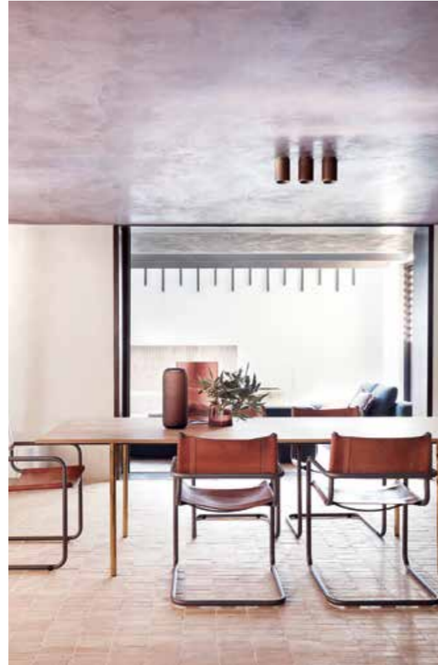
Las paredes y los techos crean efectos de texturas en toda la casa, la cual destaca por su paleta rica en colores y materiales.

En Dover Heights, un suburbio de Sydney, Australia, este hogar de 825 metros cuadrados reúne todo lo que cualquiera sueña con tener: áreas exteriores apacibles en la planta baja, incluyendo un patio y un jardín con piscina; vistas espectaculares hacia el océano desde los balcones del nivel superior; una sensación de apertura en los espacios de vida principales; y un equilibrio de colores y de materiales en toda la vivienda.