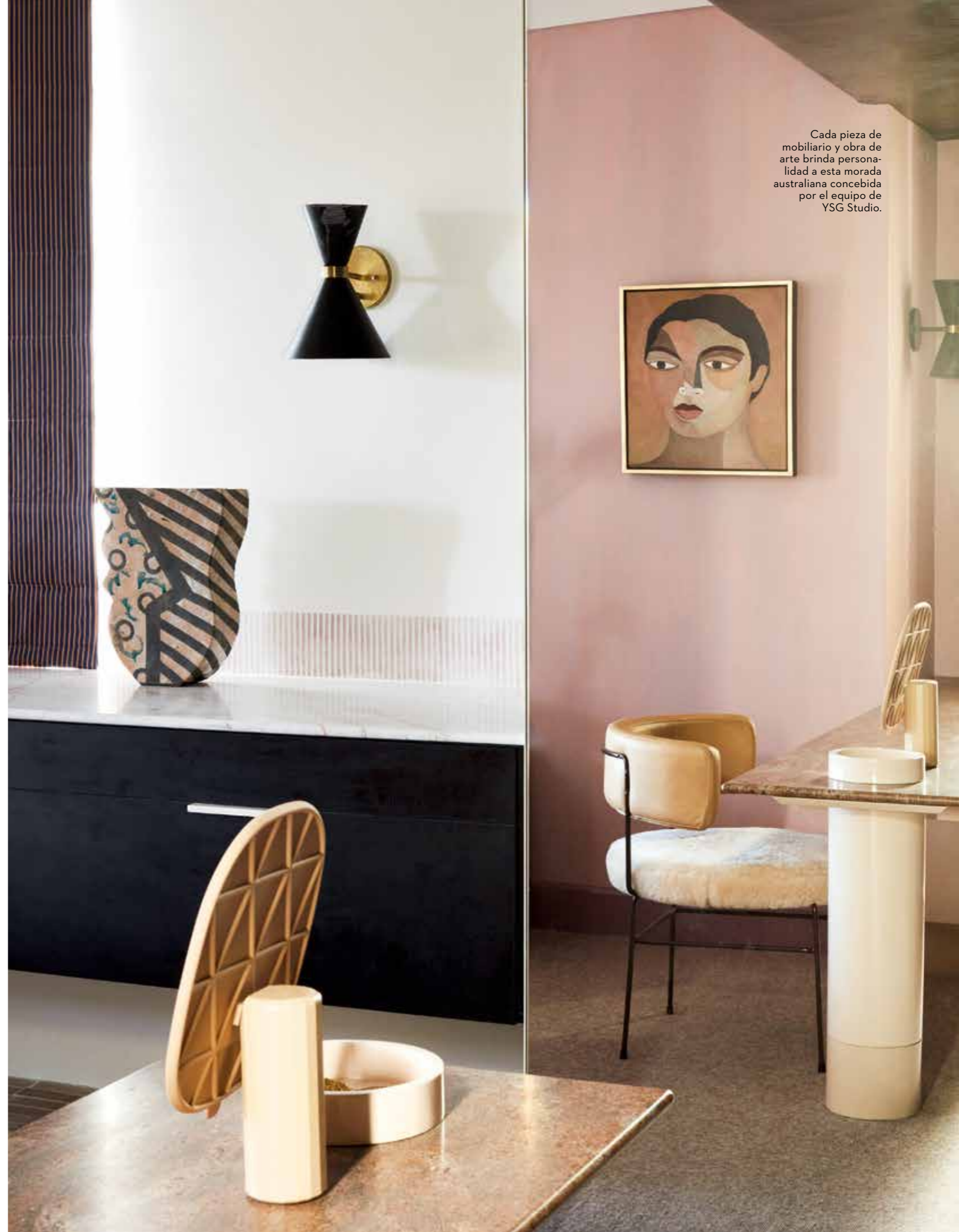
Cada pieza de mobiliario y obra de arte brinda personalidad a esta morada australiana concebida por el equipo de YSG Studio.