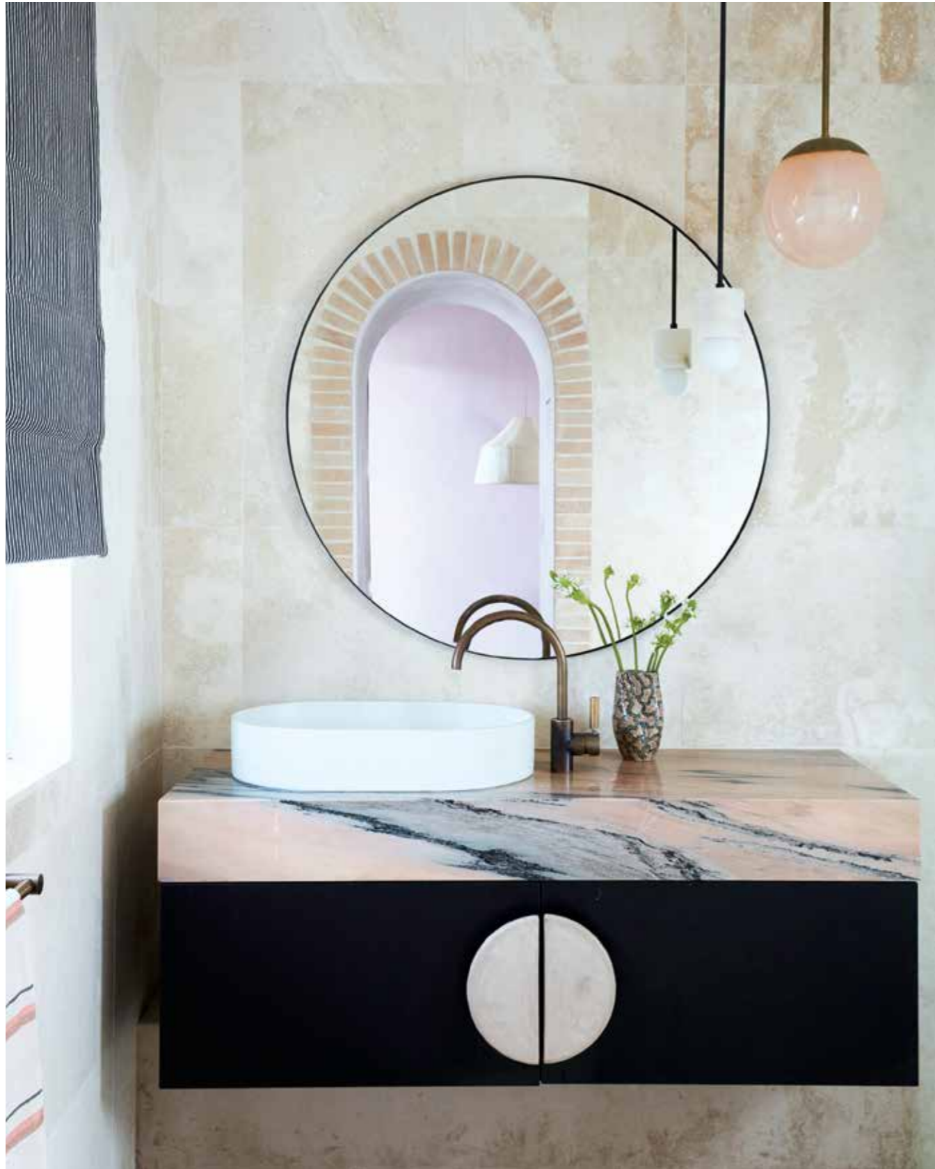
La materialidad es una de las características clave de esta residencia que desprende una sensación armoniosa, gracias a la paleta de colores suaves y a las formas curvas de varios elementos en los distintos espacios de vida.