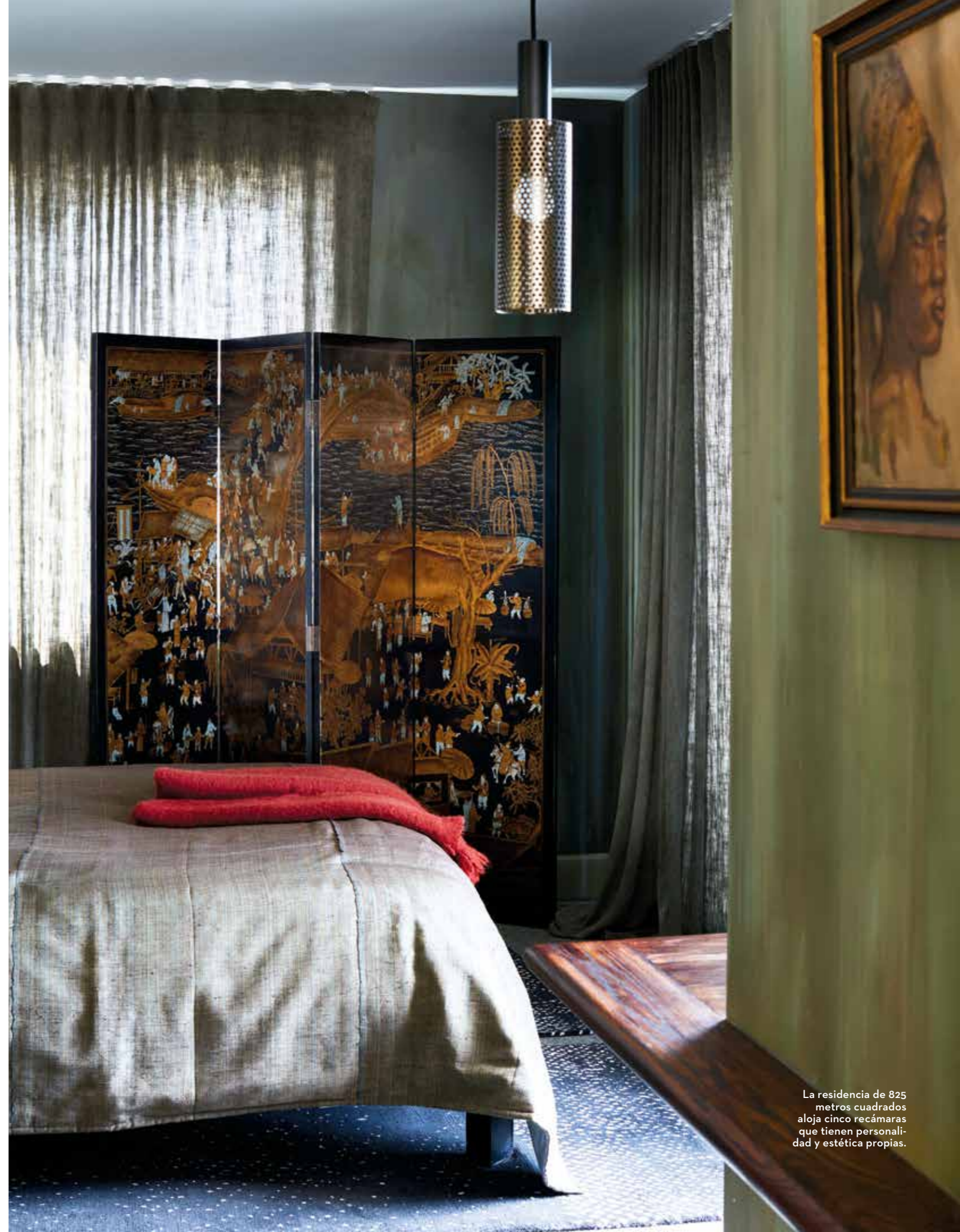
La residencia de 825 metros cuadrados aloja cinco recámaras que tienen personalidad y estética propias.