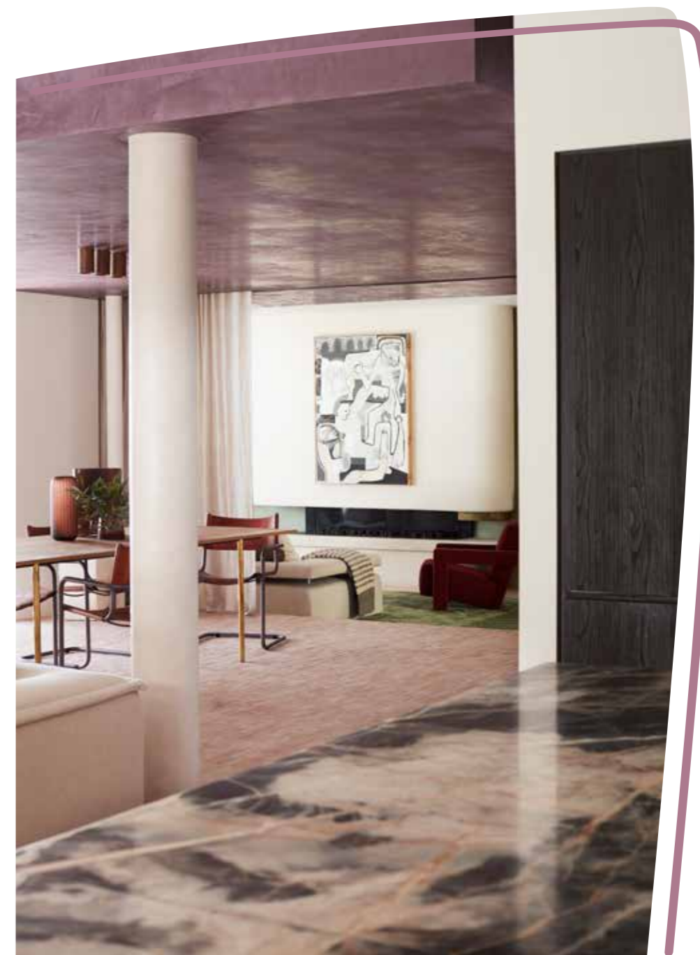
Doorkijkje vanuit de keuken naar de eetkamer en lagergelegen zitkamer