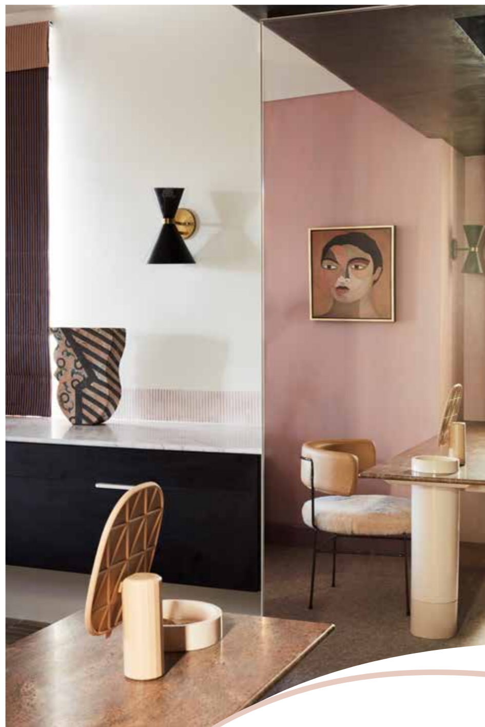
In een van de masterbedrooms staat een custommade bureau annex make-up tafel. Het blad is van Juparana Bahiamarmer via Euro Marble. Diiva Lounge Chair van Grazia & Co, make-upspiegel Mimic van Muuto. Aan de muur een kunstwerk van Radha Deva en wandlamp Tour van Atelier de Troupe. De vintage vaas komt van Rudy Rocket in Sydney