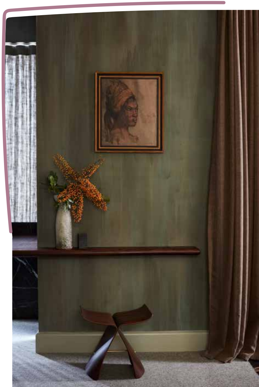
Wandafwerking van Creative Finishes, Butterfly Stool van Vitra en gordijn van Solis

Het houten scherm, de spiegel en het bad met marmeren ombouw zijn custommade. Voor de muren werd tadelakt gebruikt. Kranen van Astra Walker en wandlamp van Reduxr