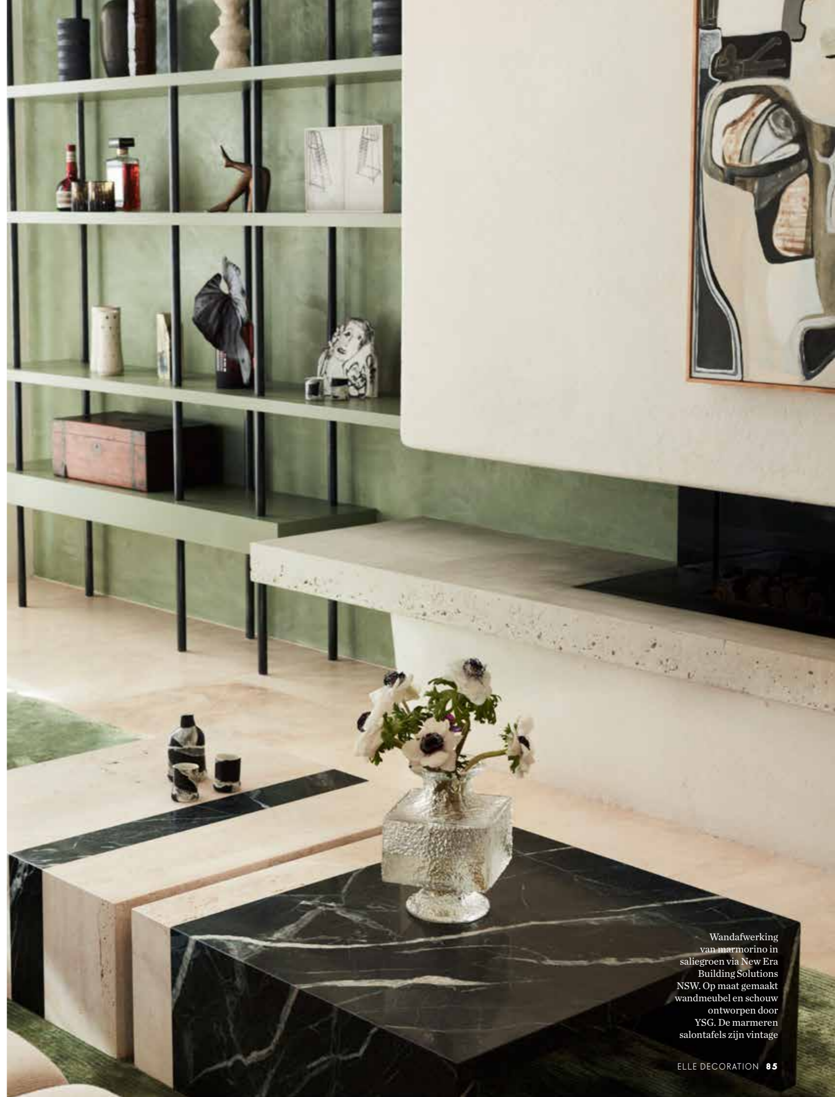
Wandafwerking van marmorino in saliegroen via New Era Building Solutions NSW. Op maat gemaakt wandmeubel en schouw ontworpen door YSG. De marmeren salontafels zijn vintage