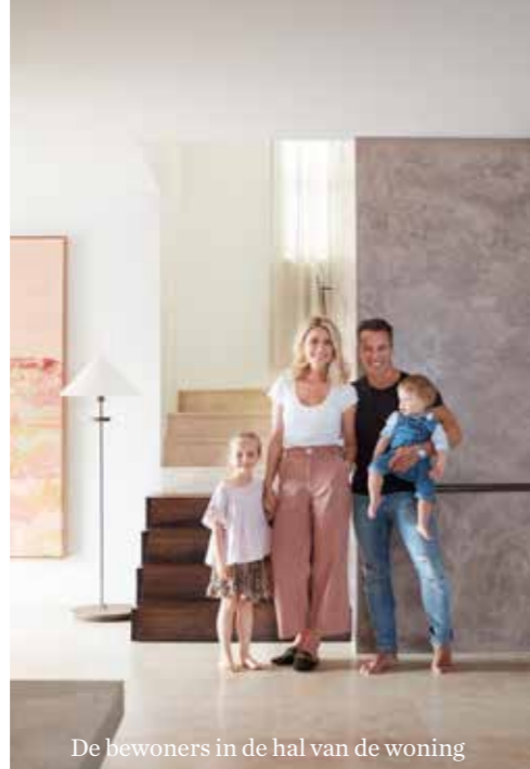
De bewoners in de hal van de woning

Ghoniem speelt in het interieur vakkundig met tinten en texturen. Neutrale vlakken worden afgewisseld met kleurrijke elementen zoals het auberginekleurige plafond. ‘Over elke beslissing is heel goed nagedacht,’ licht ze toe. ‘Toen we de terracotta tegels in de keuken legden, wisten we dat we een diepe kleur nodig hadden als contrast voor die grote terracotta vlakke. Een kleur die ook moest werken met het saliegroen van de andere wanden. De auberginekleur heeft dus een belangrijke verbindende functie.’ Wat materialen betreft koos Ghoniem contrasterende texturen. Zoals de wandafwerkingen van poederig hennepkalkstuc en glad marmorino, een