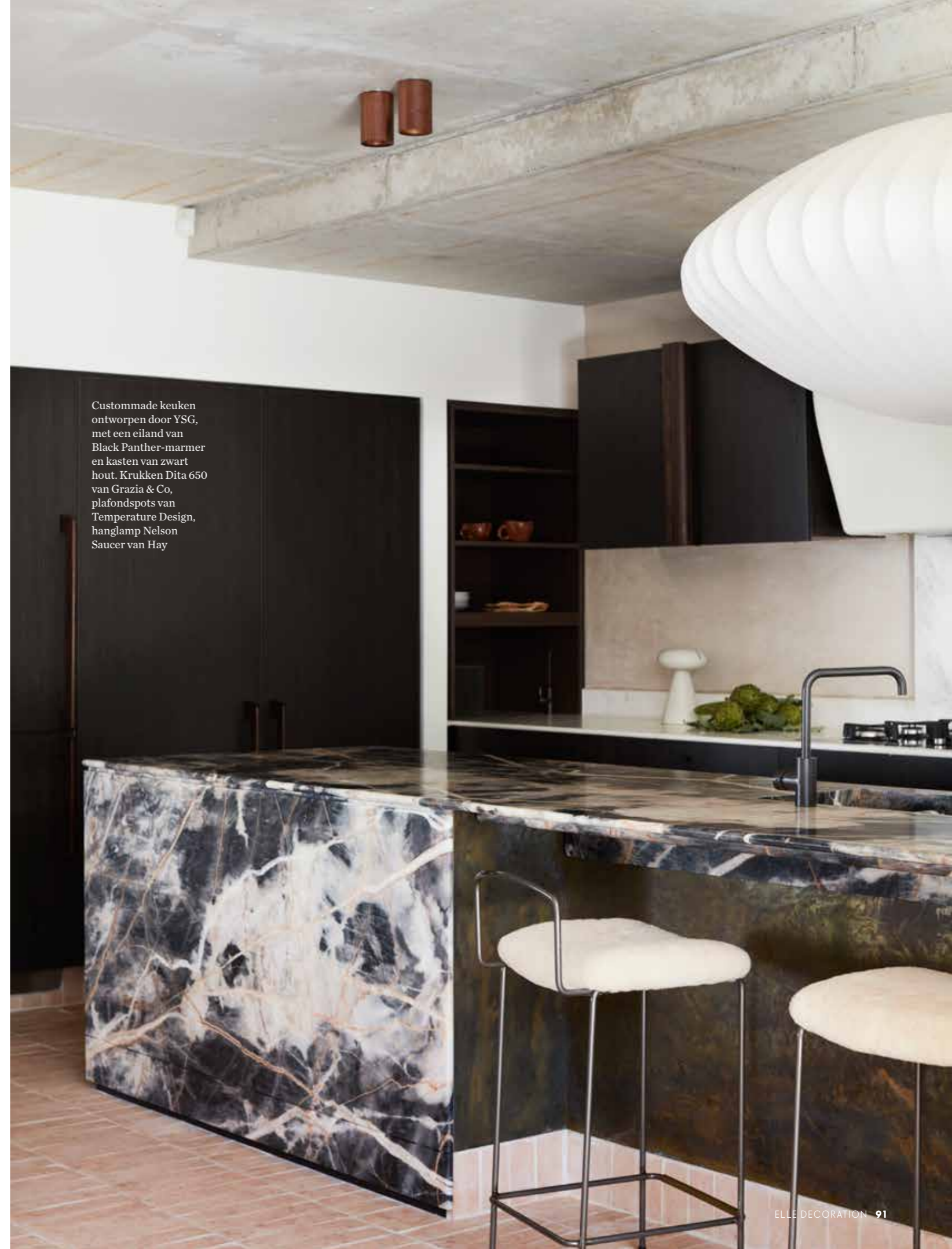
Custommade keuken ontworpen door YSG, met een eiland van Black Panther-marmer en kasten van zwart hout. Krukken Dita 650 van Grazia & Co, plafondsots van Temperature Design, hanglamp Nelson Saucer van Hay