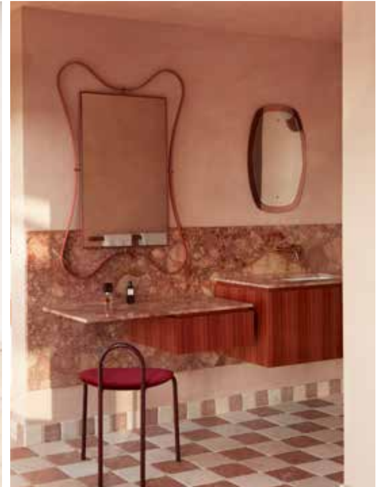
Linksboven Zelfs in de buitendouche is het marmeren tegelpatroon doorgevoerd Rechtsboven De wastafels en spatwand zijn gemaakt van Tiberio-marmer door Med Marble. Vloertegels Portagallo Marble en Rossa Verona van Aeria Country Floors Spiegel links door Rachel Donath, stoel Michelle door Tim Rundle voor SP01 Links Bestaande zonnebedden kregen een herstoffering van het Australische Rematerialised