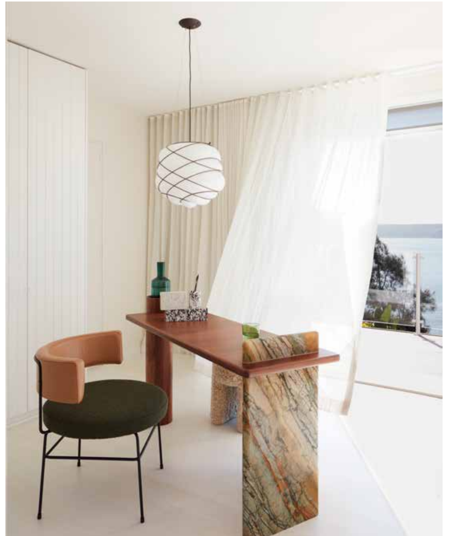
Boven Het bureau van Toledo-marmer en hout is ontworpen door YSG en gemaakt door Pullicino & Son. Lamp Cloud van Lighting Collective, stoel Big Diiva van Grazia & Co Links Ook het hoofdbord komt uit de koker van YSG en is gemaakt door Institch. Hanglamp privébezit, wandlamp van Anna Charlesworth, koffietafel gemaakt door Livio Tobler